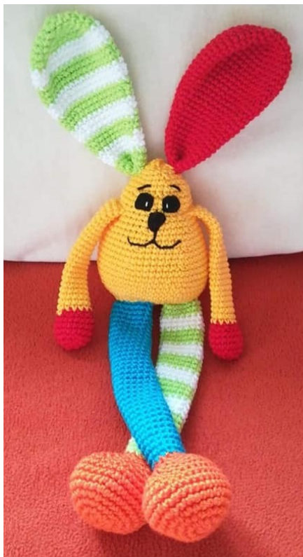
Foto mého zajdy, barvy na přání zákaznice.

Na vrch hlavy přišijeme ouška. Dala by se i přiháčkovat ve 30. řadě, byla by víc plandací ;)