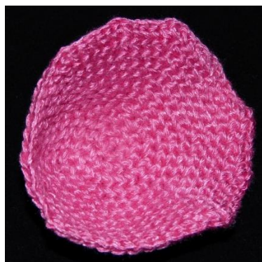
velký lístek (rub)