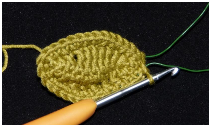
První dokončený lístek

Přízi u prvního lístečku odstříháme a můžeme nechat volně, nakonec jí zalepíme pod kobercovou pásku na stonku.