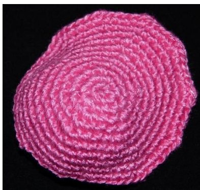
velký lístek (líc)