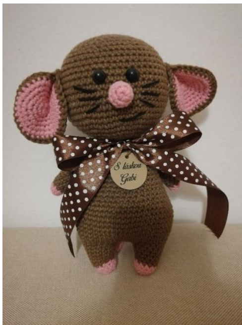
vlna Jeans (50g,160m), háčik 3.5 mm