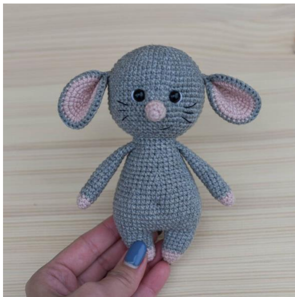
vlna alize, háčik 2.0 mm