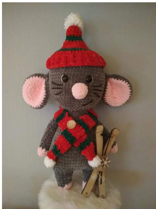
vlna Dolphin baby, háčik 4.0 mm, veľkosť 38 cm (bez čiapky)