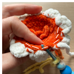
Háčkování za zadní nitku