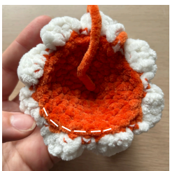
Zbývá zadní nitka Ř5