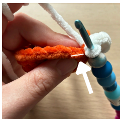
Háčkování za přední nitku