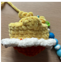
Křídýlko - Ř10