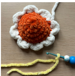
Nahození příze n kuřátko