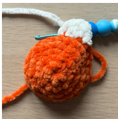
Okvětní lístek - Ř6 (1PO, 1ŘO, do dalšího oka 3DS, 1ŘO, 1PO)