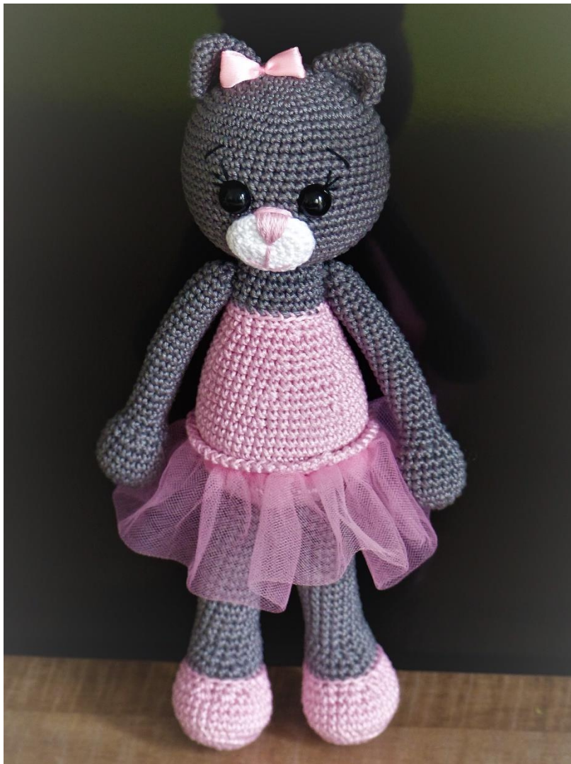
Velikost Kočičky je 26 cm